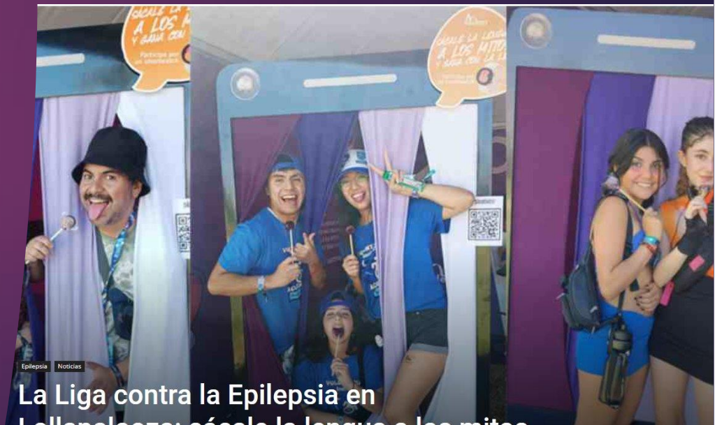
La Liga contra la Epilepsia en Lellenpezco: pécale la lengua a los mitos